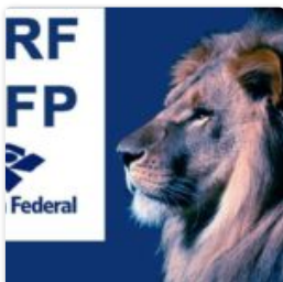
Tabela IRRF 2017